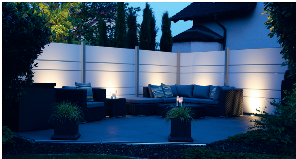
Tuinschermen met architecturale meerwaarde.

Door haar indrukwekkende afmetingen van 396 op 800 en 396 op 1200 millimeter en strakke design creëert de SUPERSIZE een bijzondere sfeer en maakt ze een verscheidenheid aan aantrekkelijke legpatronen mogelijk. Denk aan kruisverband, halfverband, klezorenverband en nog veel meer.